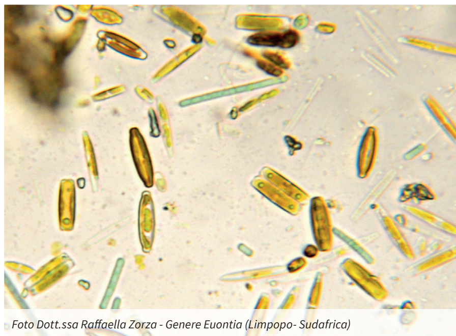
Genere Euontia (Limpopo- Sudafrica)

rendimenti migliori, dimostrando che le soluzioni naturali possono essere non solo efficaci, ma anche economicamente vantaggiose. La terra di diatomee, con la sua storia antica e i suoi molteplici utilizzi, si rivela quindi un alleato prezioso non solo per l'agricoltura, ma anche per la conservazione della biodiversità.