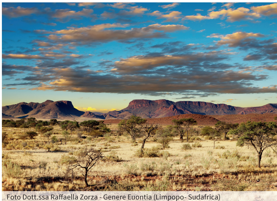
Genere Eumontia (Limpopo- Sudafrica)