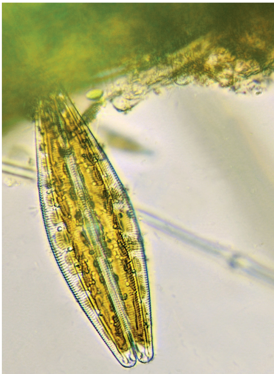
Genere Euontia (Limpopo- Sudafrica)

Ad esempio, viene usata nelle aree di alimentazione dei rinoceronti per controllare parassiti come zecche e pulci. Un esempio interessante proviene dal Sudafrica, dove alcune comunità rurali hanno iniziato a combinare l'uso della terra di diatomee con tecniche tradizionali di controllo dei parassiti, creando un modello ibrido che unisce innovazione e saggezza popolare. Le colture trattate in questo modo mostrano una maggiore resistenza alle infestazioni e offrono